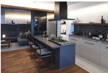
映画のような暮らし MODERN MODEL Theatre テアトル