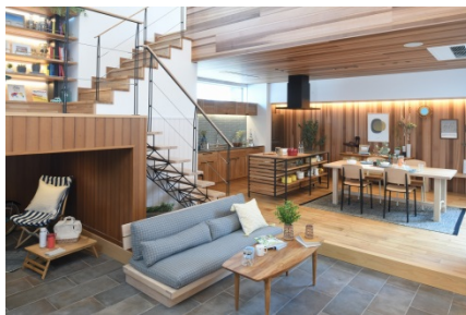
西海岸スタイル COUNTRY MODEL Calif カリフ