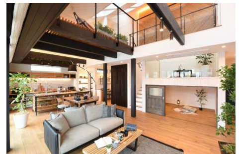
★明るく開放的な勾配天井&トップライト