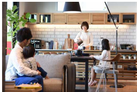
★コミュニケーションを大切に考える「らくま」